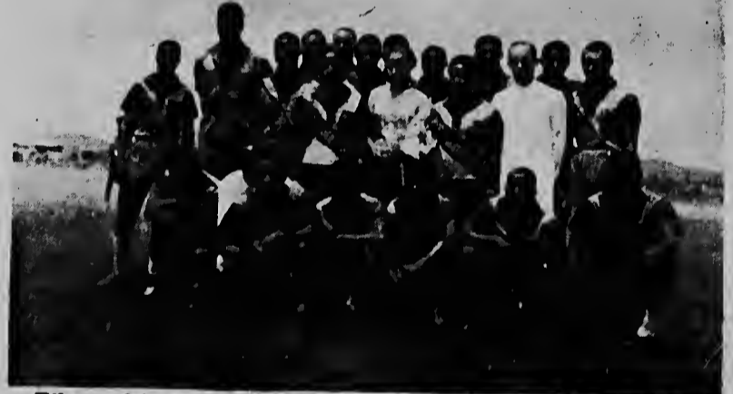
Riba e foto aki nos por mira e equipo di Centro Buena Vista, no mucho tempu despues cu el a ser funda. Si nos mira e caranan di awendia, nos lo mira hopi cara stranjo.

Mi a yega di haña tres ataque entre 3 di januari di 1963 y 29 di december 1965. M a consulta mi dokter y el a conseha mi di stop di usa bebida alcoholico. Pero nunca e no a bisa mi ta di con mi a haña e ataquenan aki. Awor mi kier sa ki efecto e ataquenan aki por tin ri-